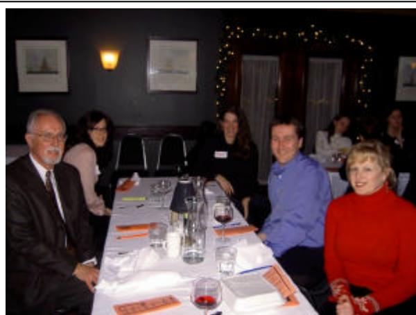
Dalhousie annual Mentoring Event, March 1 st 2005